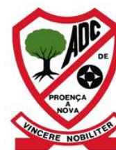
A.D.C. PROENÇA A NOVA