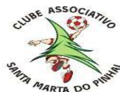
C.A. STª MARTA do PINHAL