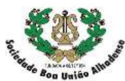
S.B. UNIÃO ALHADENSE