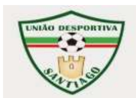
U.D. SANTIAGO DA GUARDA