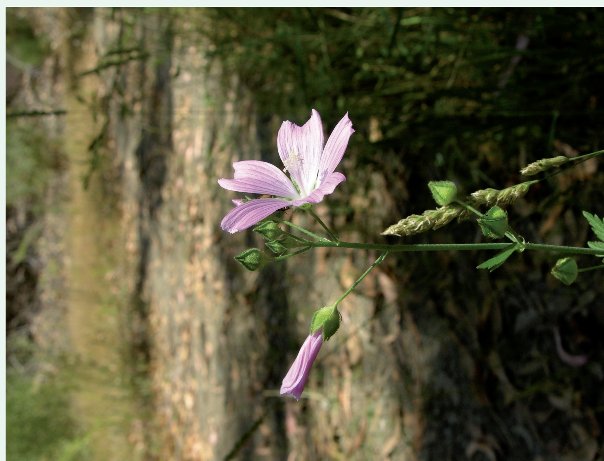
MALVA | Mallow - Malva sp. Eudicotiledonea / Malvaceae

FLORES QUE DESTACAM NO MEIO DOS PRADOS. | Flowers among the meadows.