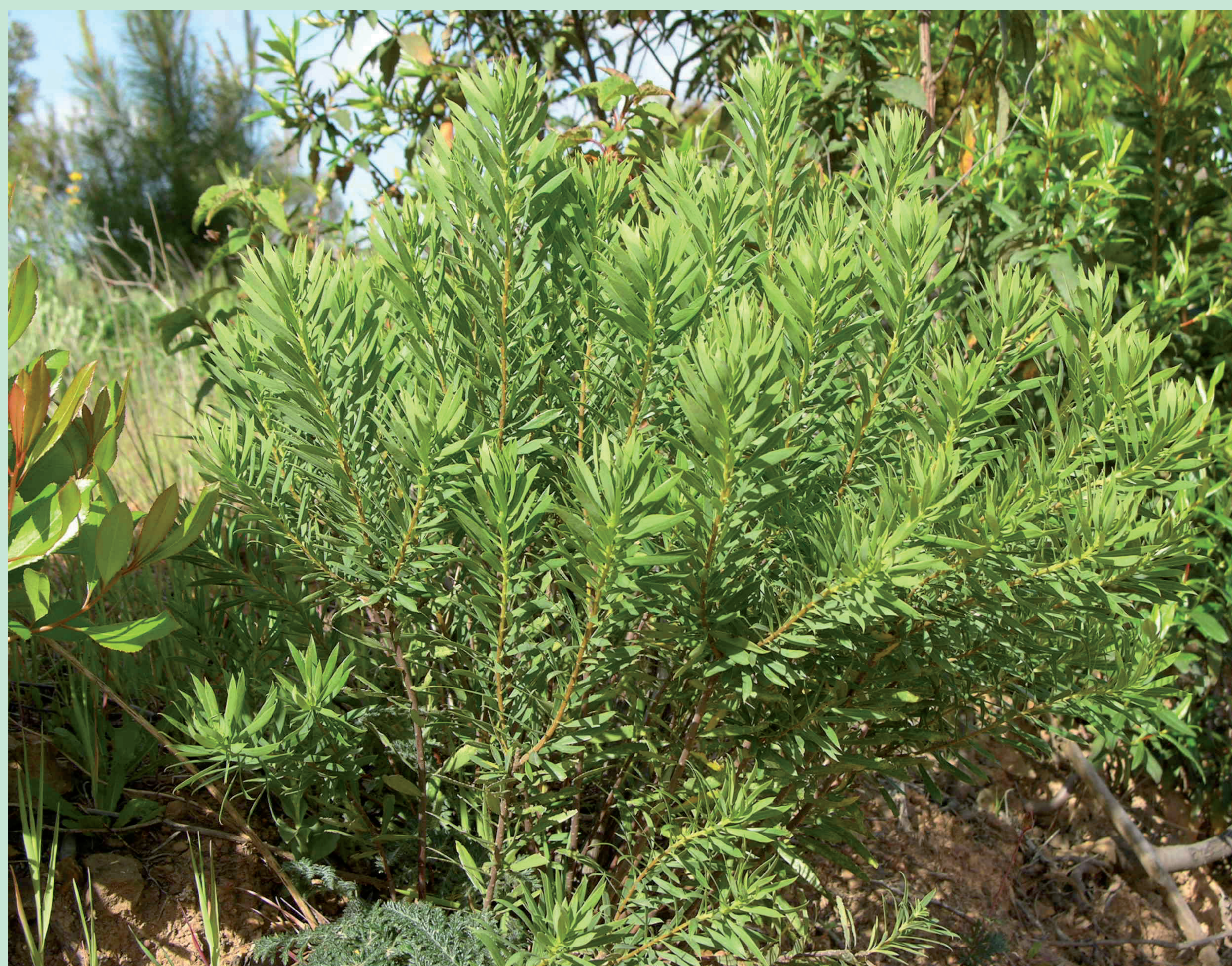
TROVISCO | Spurge Flax - Daphne gnidium Eudicotiledonea / Thymelaeaceae

TAL COMO O MEDRONHEIRO, O CODEÇO E O TROVISCO SÃO ARBUSTOS TÍPICOS DOS MATOS MEDITERRÂNICOS. | As the Strawberry Tree, the Codeso and the Spurge Flax are typical shrubs of the Mediterranean landscapes.