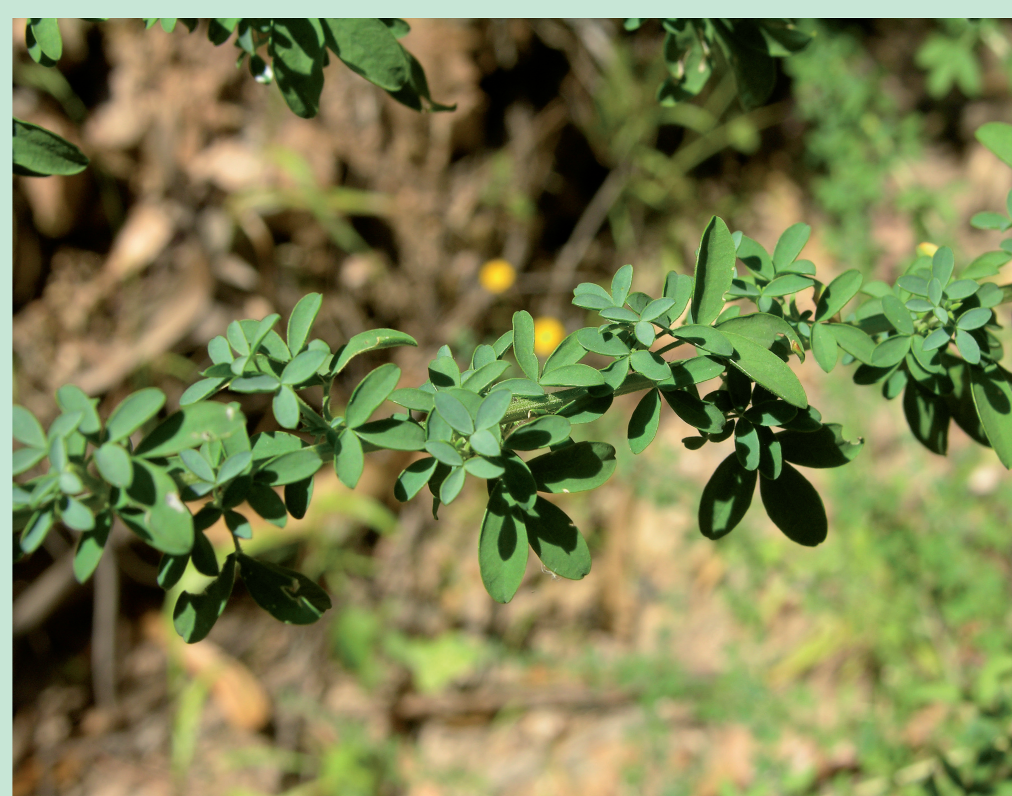
CODEÇO | Codeso - Adenocarpus sp. Eudicotiledonea / Fabaceae

This shrub has persistent leaves and may measure two meters. Its leaves and fruits are extremely poisonous.