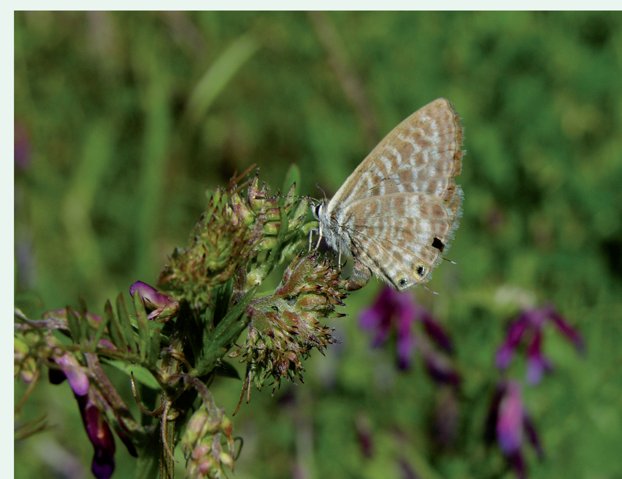
CINZENTINHA | Lang's Short-tailed Blue - Leptotes pirithous Insecta / Lepidoptera / Lycaenidae

Try to distinguish them from the bottom of the wings. In this one, light brown with wavy, white stripes with a clearly visible white stripe on the tip of the back wing.