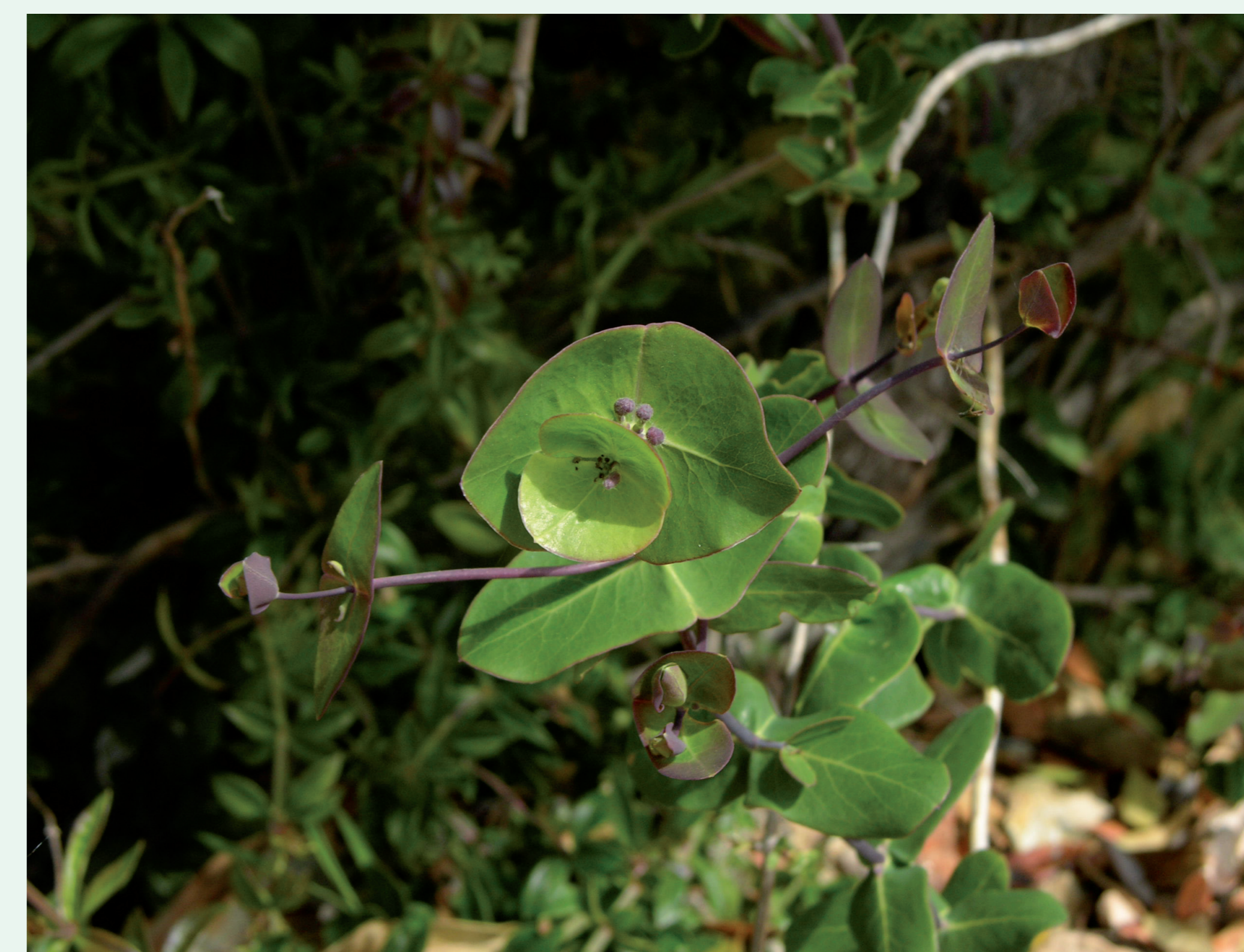
MADRESSILVA-ENTRELAÇADA | Honeysuckles - Lonicera implexa Eudicotiledonea / Caprifoliaceae

Nesta espécie as folhas superiores têm as bases soldadas em redor do caule.