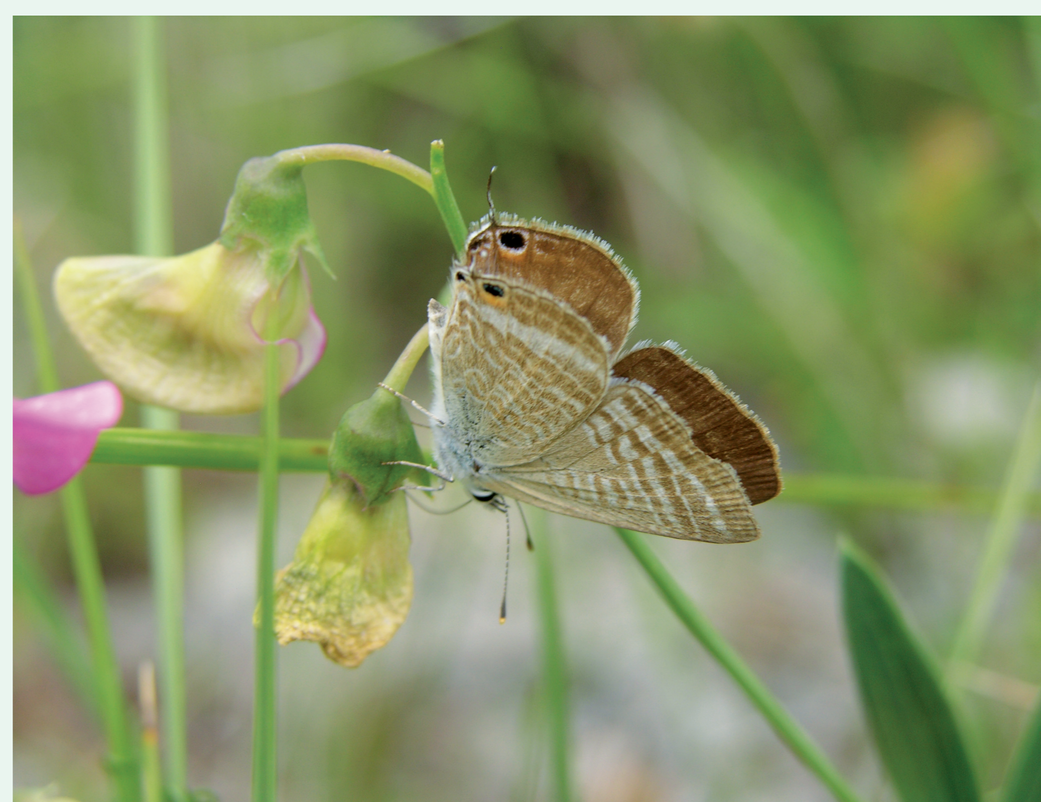
AZULINHA | Long-tailed Blue - Lampides boeticus Insecta / Lepidoptera / Lycaenidae

ESTAS DUAS BORBOLETAS PÕEM OS OVOS EM FLORES DE LEGUMINOSAS. | These two butterflies lay their eggs on grain legume flowers.