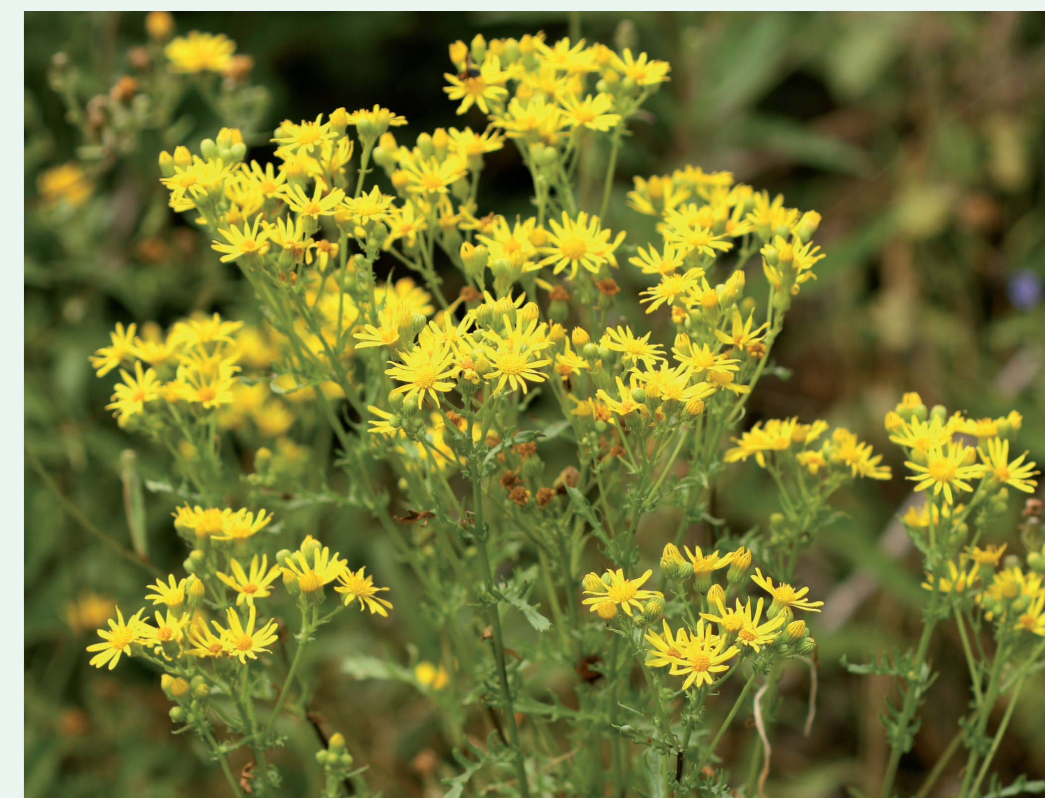
SENÉCIO | Stinking willie - Senecio jacobae Eudicotiledonea / Asteraceae

Pale pink flowers appear slightly above the ground.