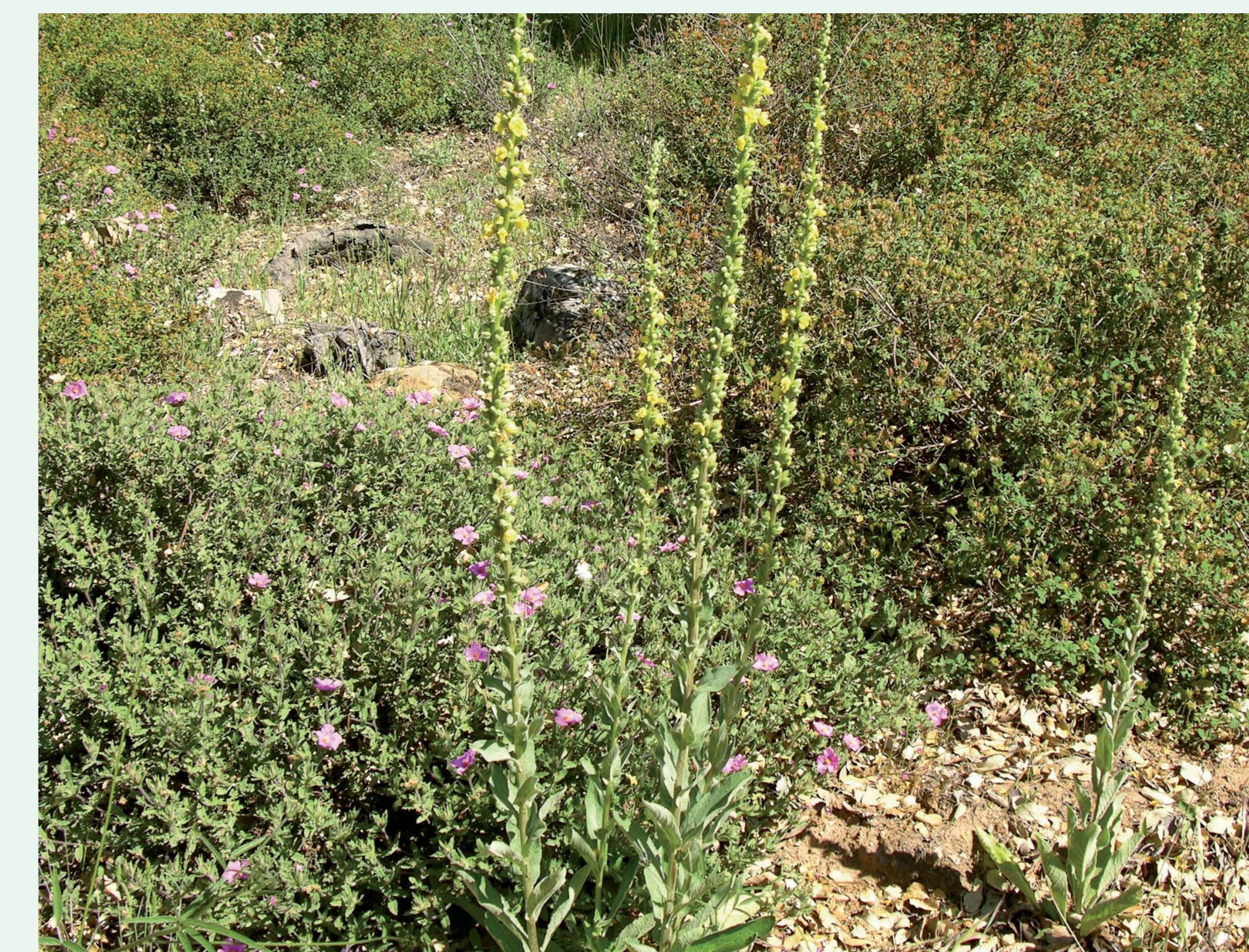
VERBASCO | Mullen - Verbascum sp. Eudicotiledonea / Scrophulariaceae

They have numerous yellow flowers and look like small daisies.