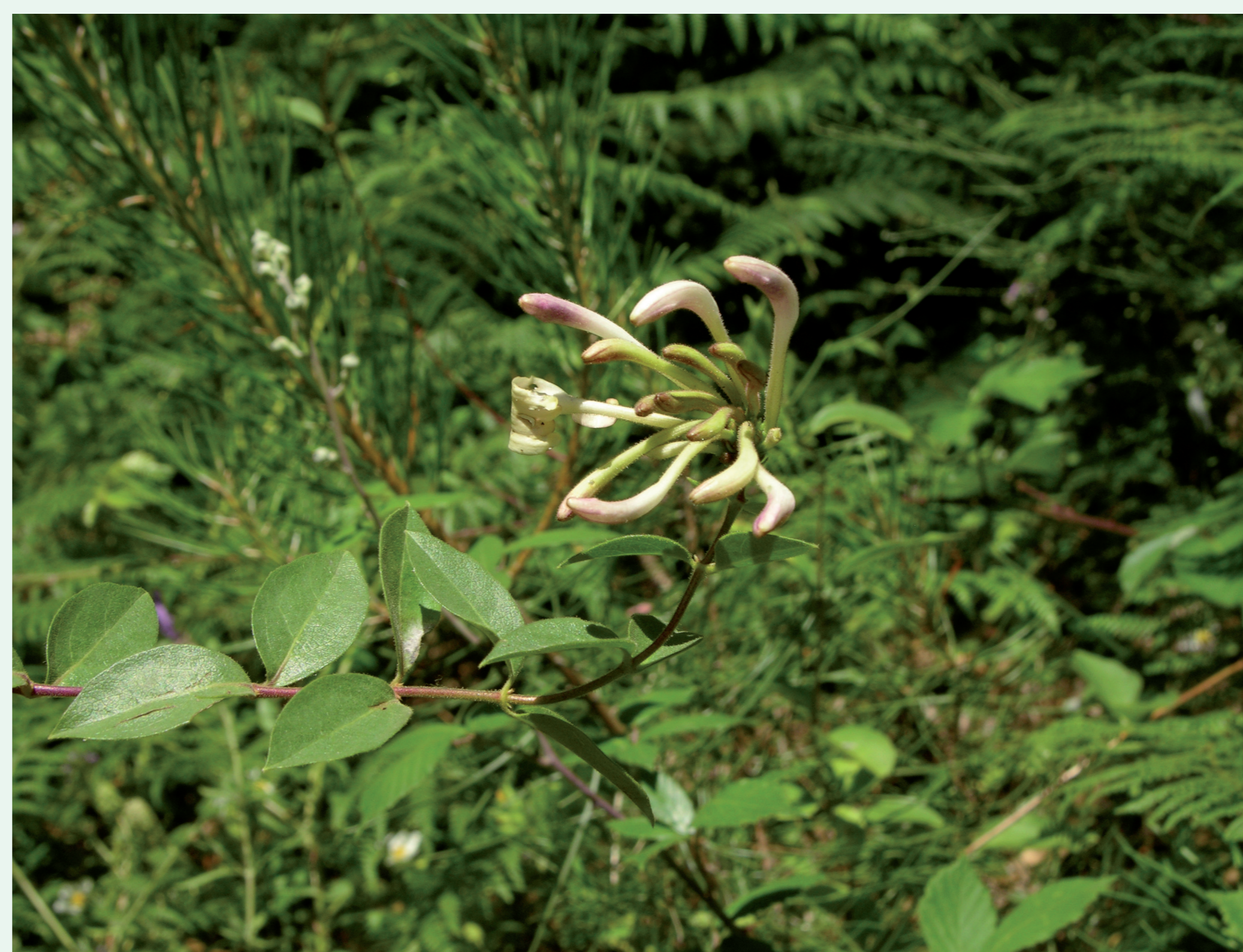
MADRESSILVA-DAS-BOTICAS | Honeysuckles Lonicera periclymenum Eudicotiledonea / Caprifoliaceae

MADRESSILVAS – TREPadeiras DO GÉNERO LONICERA | Honeysuckles – Vines of the genus Lonicera