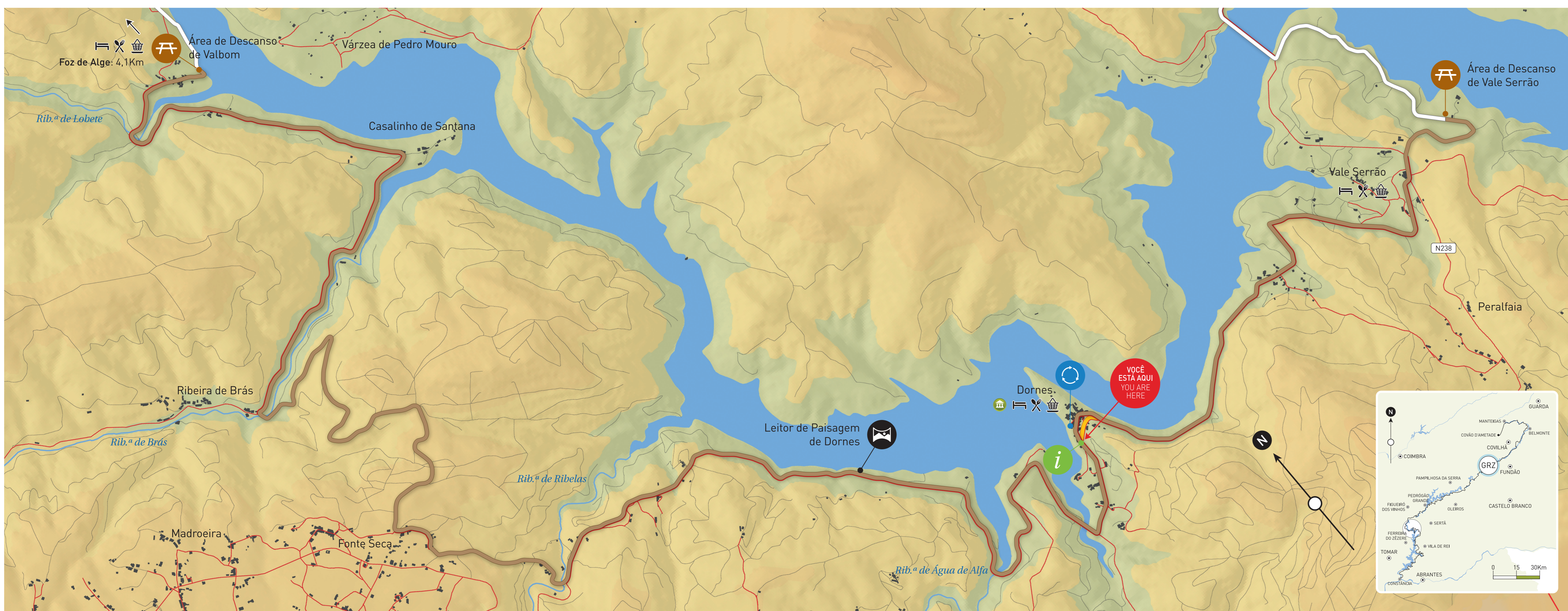
Mapa n.º IGEEOE / 1:25.000: 288 / Map IGEEOE / 1:25.000: 288

Situated on a peninsula in the Zêzere River, Dornes Village is rich in history, heritage, legends and religious manifestations. Here trod the Romans, who extracted gold from the waters of the river and erected the first buildings. It was on the basis of these ancient ruins that Gualdim Pais built the unique five-sided Templar tower, for the defence of the land during the Reconquista. Under the protective shadow of the medieval watchtower, the parish church was erected in the 13th century, at the behest of the Queen Saint Isabel herself according to legend, with Guilherme Pavia having received instructions to place the sacred pieta of Nossa Senhora do Pranto there. Many different legends are associated with her and devotion to her made Dornes an important religious pilgrimage centre during the Middle Ages. To this day, pilgrims flock here from across the region, the Círios Pilgrimages, between Easter and the third Sunday in September, the high points being Pentecost Sunday and 15 August. In 1321, this old Town belonged to the Order of Christ and, in 1353, it already had a civil-law notary. In 1513, Dornes reached its peak when it was granted a status of council by King Manuel I.