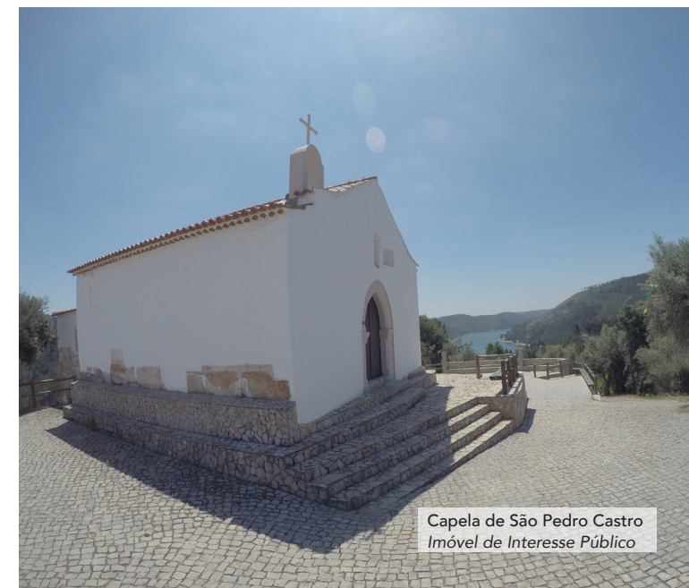
Capela de São Pedro Castro Imóvel de Interesse Público

Take many photos: you will like to remember those moments.