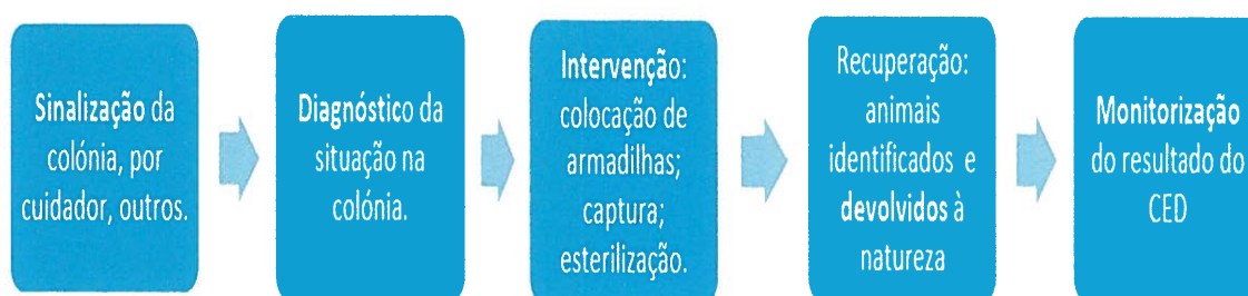
Diagrama 1. Resumo de passos do programa CED.

As visitas de diagnóstico às colónias de gatos errantes propostas para CED, foram realizadas com o intuito de: