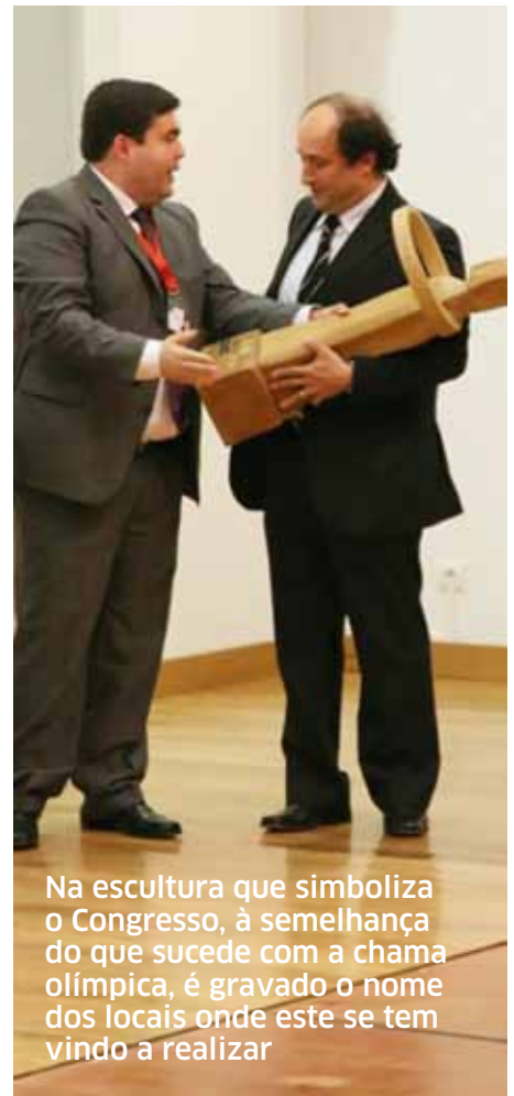
Na escultura que simboliza o Congresso, à semelhança do que sucede com a chama olímpica, é gravado o nome dos locais onde este se tem vindo a realizar